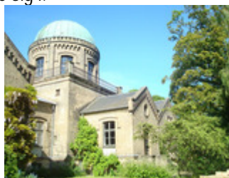
Undersøgelingsbaseret undervisning kan fx foregå andre steder end i klasseværelset. Et sted kunne være observatoriet, der ligger som nabo til det danske institut (IND), der er knyttet til PROFILES projektet.

Udgangspunktet i projektet er en bred undersøgelse af hvilke elementer inden for naturvidenskaberne, der er vigtigst for eleverne at kunne forholde sig til - og som derfor vil være motiverende, at fordybe sig i.